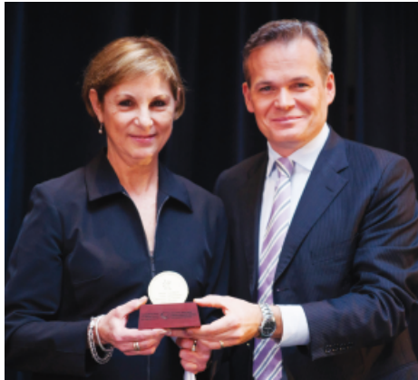
Champions of Mental Health Award / Champions de la santé mentale

We enjoyed our first year in our new premises. In November we invited members and friends to an open house, where we launched Food For Every Mood , a cookbook featuring tasty recipes along with illustrations by individuals living with mental illness. More than one-third of the first printing was sold before the end of 2011. The project was overseen by our fundraising committee.